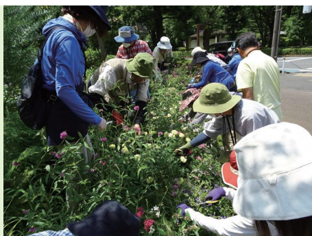
▲ 枝透かしや切り戻しをします。

今回が初めてのお手入れ実習でした。お手入れのポイント（茶色いものを取り除く、エッジを際立たせる、大きくなった雑草をとる）や、植物ごとにどのようなお手入れしたらよいのか（切る場所や切る程度など）を学びました。実習終了後は、使用した道具の片付けや園芸バサミのお手入れ（ヤニとりスプレーで刃をきれいにする）を行いました。